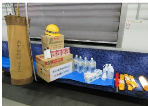
(避難車両への備蓄品の積み込み)