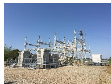
△嵩上げ後の変電所

浸水が想定される場所や実際に浸水した場所の鉄道用変電所について、更新改良工事等の計画にあわせて施設のかさ上げを実施しています。