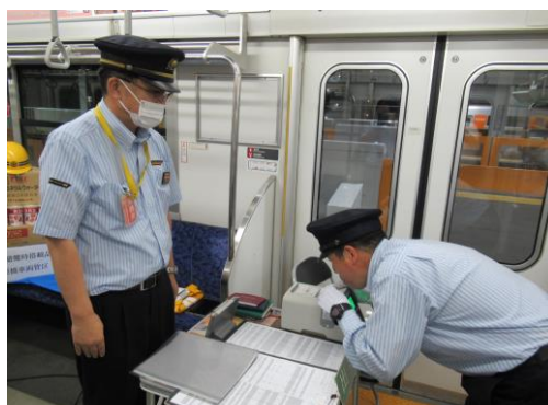
(車内における乗務員のアルコール検査)