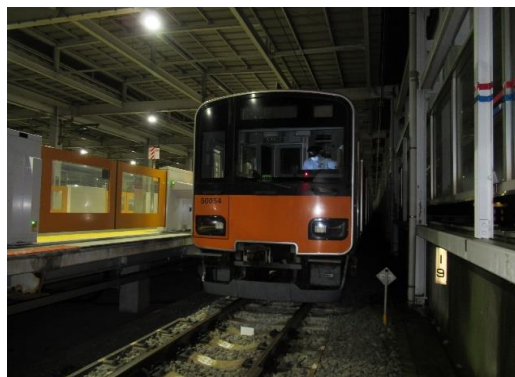
(留置された避難車両)