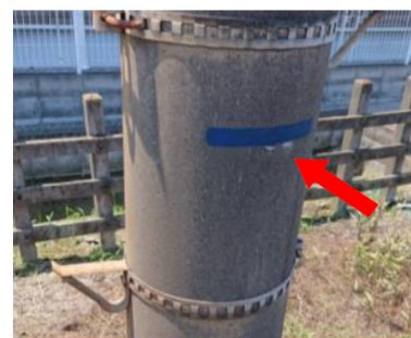
△浸水深マーキング

これにより、従業員が現地で周辺の水レベルを容易に確認できる環境が整備されるほか、今後施設の更新を行う際のかさ上げの目安に活用していきます。